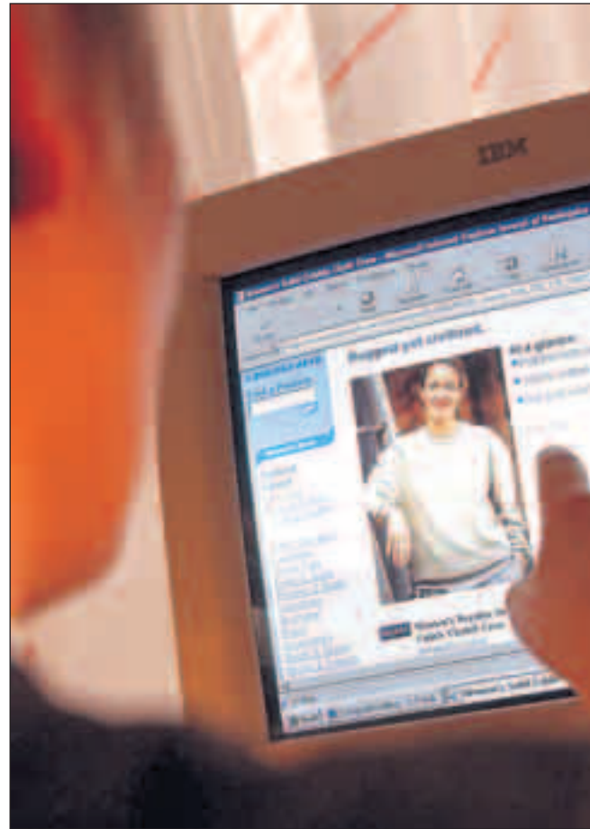
Regninger fra amerikanske »domænefirmaer«, der bygger på et falsk grundlag, har ramt bredt hos eksempelvis Dandomains kunder.

»Fupregningerne er meget udbredt, og desværre er der